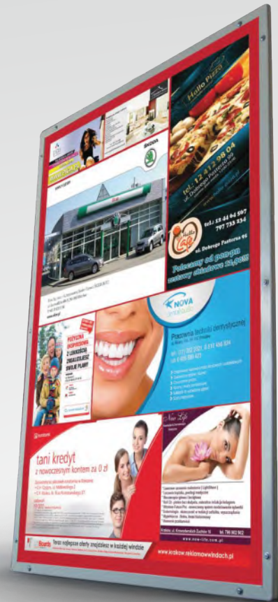
wizualizacja nośnika Liftboards

W wielkich blokowiskach mieszkają tysiące osób, do których firmy próbują dotrzeć np. poprzez ulotki, gazetki, listy itp. Te rzesze potencjalnych klientów codziennie przez kilka minut spędzają bezproduktywnie swój czas w windzie, jadąc do pracy, na zakupy czy do domu... Dlaczego nie wykorzystać tego czasu na odbiór reklamy?